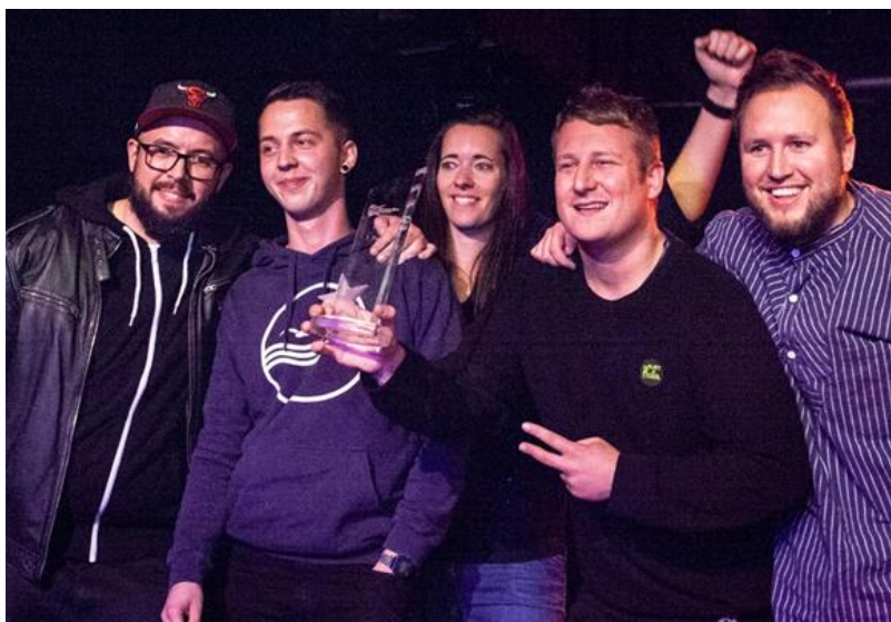
Apollo Circus winnt Plattsounds 2018