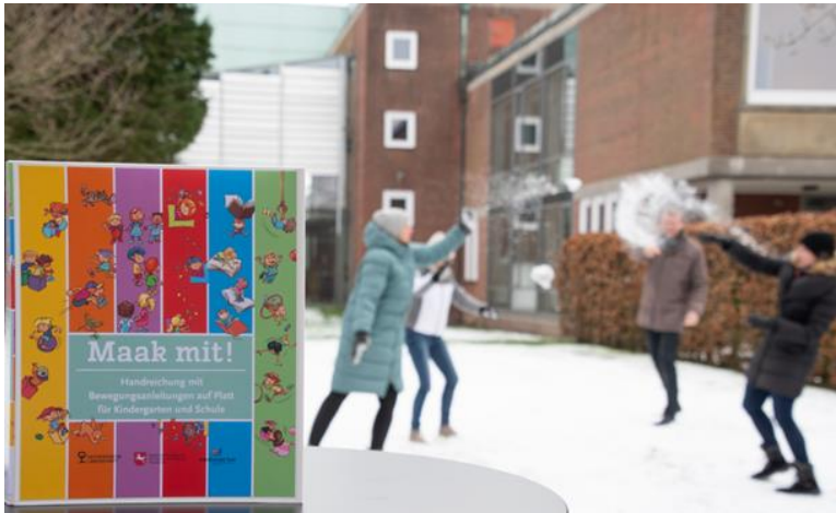
De neje Handreichung för Kinnergaarns und Scholen: „Maak mit!“